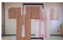
和服製作作業の作品例