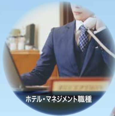
ホテル・マネジメント職種