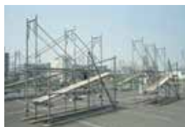
とび作業の作品例