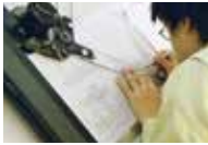
機械製図手書き作業の実施風景