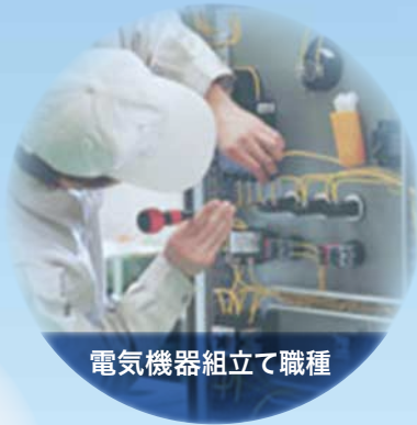
電気機器組立て職種